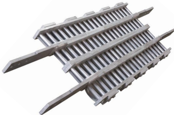
Primer plano de un Technogrid®

The Technogrid® consiste en una serie de unidades de barras múltiples interconectadas en un modelo de rejilla en zigzag. Al momento de impacto, las barras cederán y se deformarán bajo una doble curvatura de flexión. La deformación de las barras es lo que permite que las unidades se abran y se estiren, y eso es la zona de endurecimiento que absorbe la energía de impacto.