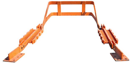
Rechazar la detención con marco de captura y Technogrid®

El Technogrid® puede absorber cualquier impacto en la medida en que el armazón de detención o impacto esté diseñado para poner el Technogrid® en tensión. Se muestran en esta página varios ejemplos de diseño de estructura para choque/detención. Estos van desde el simple gancho a los más complicados etapas de compresión para absorber la energía de las explosiones de tanques de granulación.