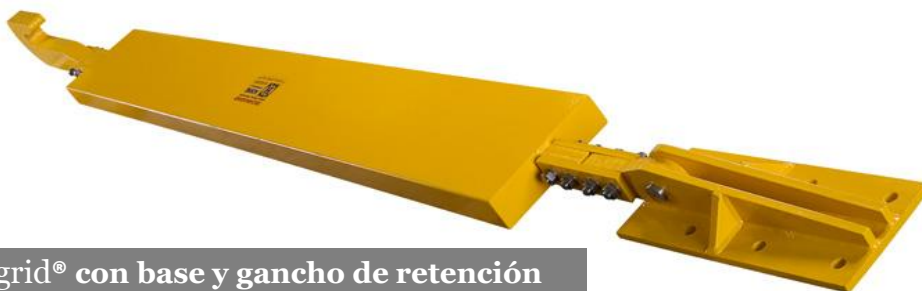
Technogrid® con base y gancho de retención

Para aplicaciones que requieren energía mas específica, se puede calcular fácilmente el diseño específico del Technogrid® adecuado. Una desaceleración segura y fuerzas de alta capacidad pueden ser controladas para un amplio rango de energías. Se pueden crear configuraciones óptimas combinando las rejillas en series o paralelas para aplicaciones específicas.