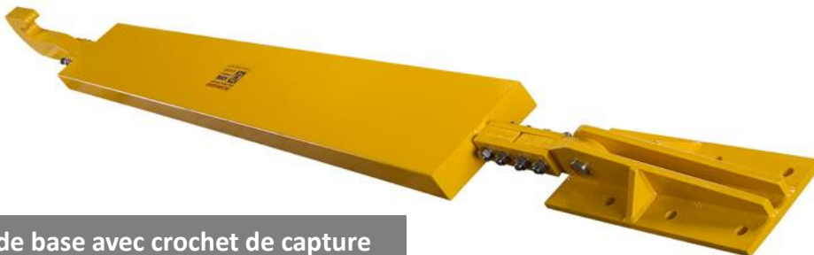
Technogrid® de base avec crochet de capture

Pour les exigences énergétiques plus importantes et spécifiques, le Technogrid® peut aisément être calculé et conçu pour répondre aux demandes. Une décélération sûre et des forces de haut niveau peuvent être contrôlées pour une gamme importante d'énergies. L'assemblage en série ou en parallèle des Technogrid® permet une configuration optimum des dispositifs pour répondre à chaque demande particulière.