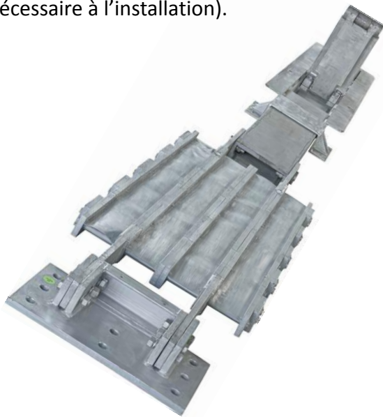
Dispositif Technopost ® de 120Kj (butée de station ferroviaire pour les mines)

Pour les demandes d'énergie plus importantes, le nombre de dispositifs installés peut être augmenté. Ceux-ci seront alors installés en parallèle (deux Technogrid ® doublent l'énergie pouvant être absorbée). Des Technogrid ® multiples peuvent également être installés en série. (deux Technogrid ® doublent l'amplitude nécessaire à l'installation).